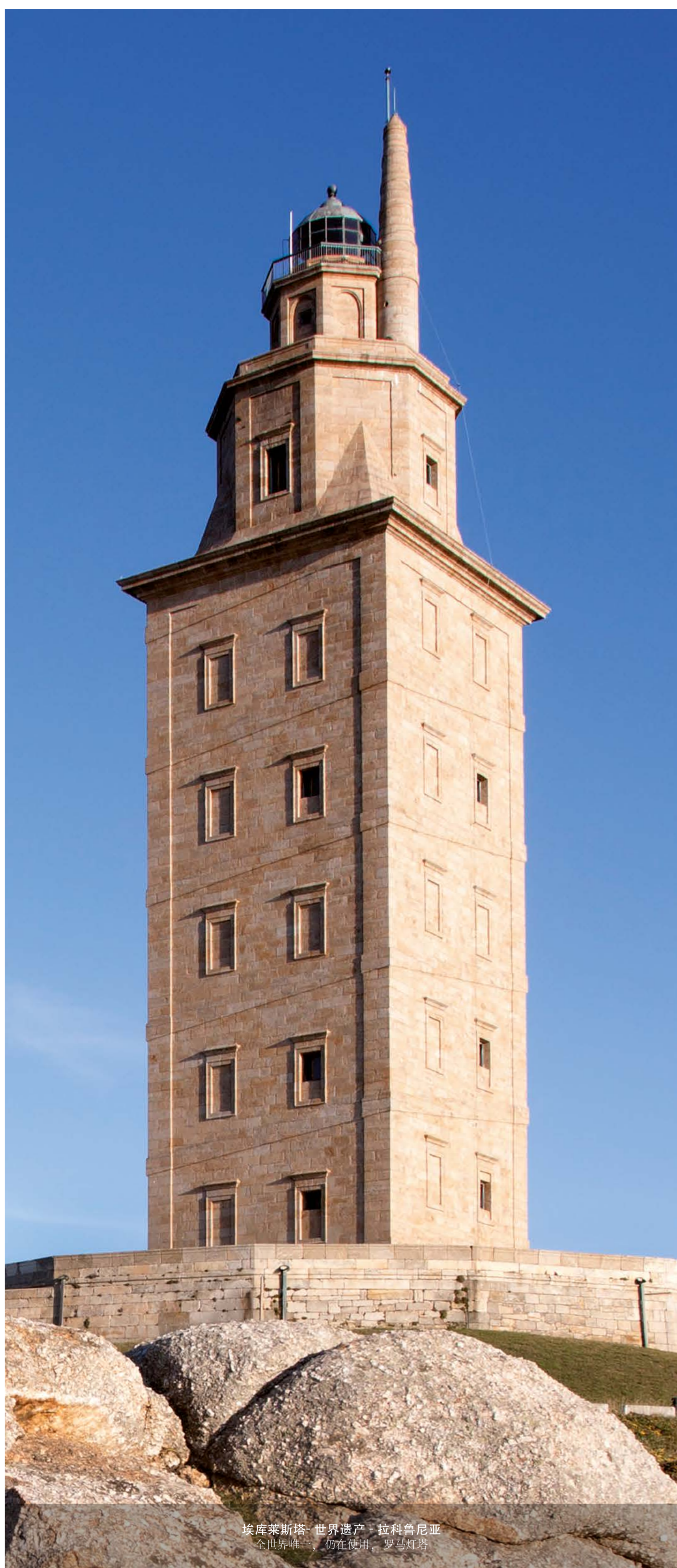
埃库莱斯塔-世界遗产-拉科鲁尼亚 全世界唯一，仍在使用的，罗马灯塔