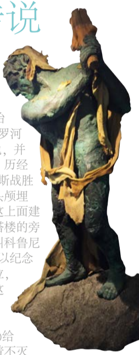
在游客接待和陈列中心的埃库莱斯雕像 (Francisco Leiro), 1992

从前有个巨人叫赫里昂(Gerión)，统治着塔霍河(Tajo)与杜罗河(Duero)之间的土地，并威胁到所有的人类。历经3天的搏斗，埃库莱斯战胜了巨人，把巨人的头颅埋在了土地上，并在这上面建立了一座塔楼。在塔楼的旁边，他建立了一个叫科鲁尼亚(Crunia)的城市，以纪念在这里生活的第一位，并且也是他爱上的这位女性。后来埃库莱斯离开了，爱斯潘(Espán)给塔楼赠送了一支有着不灭之火的蜡烛，并且在塔楼上安装了一面巨大的镜子，以监视来往的敌军船只。